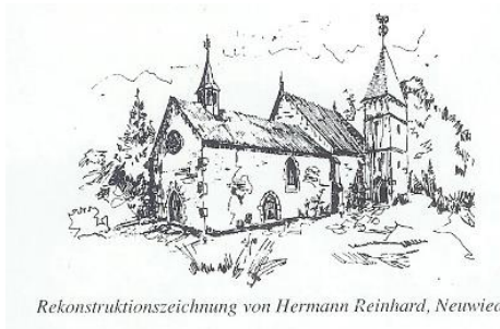
Rekonstruktionszeichnung von Hermann Reinhard, Neuwied